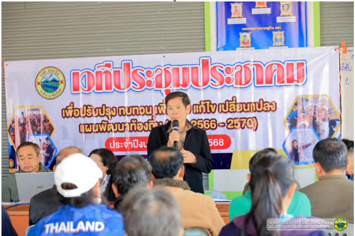
ภาพประกอบ หมู่ที่ ๘ บ้านหนองบัว